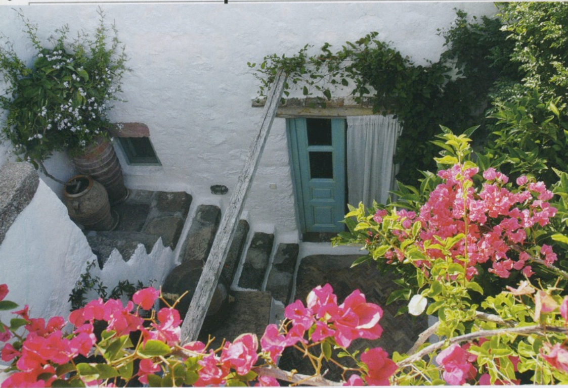
Εξωτερικά σκαλοπάτια συνδέουν διαφορετικά επίπεδα του σπιτιού, με ανοίγματα και πράσινο στο μέγιστο δυνατό βαθμό. Η ολάνθιστη μπουκαμβίλια συμπληρώνει το δωδεκανησιακό σκηνικό.